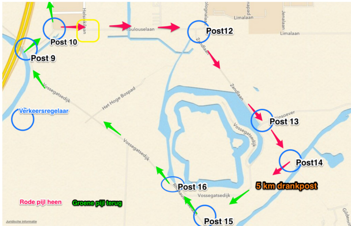
Deel 2 posten ZAC MW.